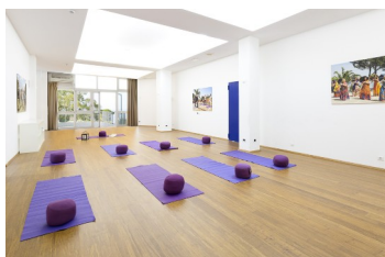
Unsere Bewegungsraum in Hotel Kalura

Nia geht von der Annahme aus, dass wir uns besonders dann gerne bewegen, wenn die Trainingsstunden abwechslungsreich sind und Freude machen. Nia ist für alle die Menschen geeignet, die eine Alternative zu den herkömmlichen, schnellen Fitness-Stunden suchen. Für eine Nia-Stunde gibt es keinerlei Voraussetzungen, Spaß an Bewegung reicht – alle sind willkommen!